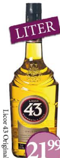
Licor 43 Original