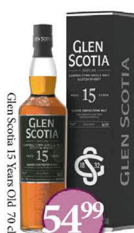
Glen Scotia 15 Years Old 70cl