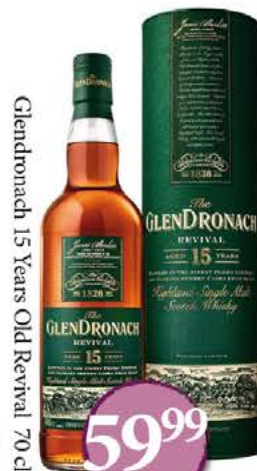
Glendronach 15 Years Old Revival 70 cl