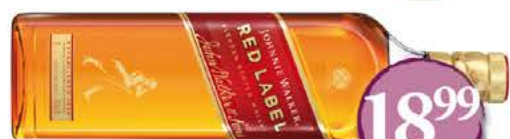
Johnnie Walker Red Label LITER