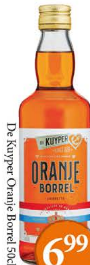
De Kuyper Oranje Borrel 50cl