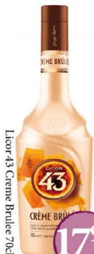
Licor 43 Crème Brûlée 70cl