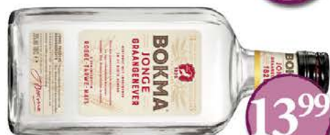
Bokma Jonge Graangenever LITER