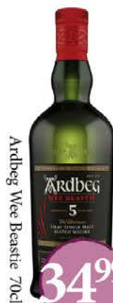
Ardbeg Wee Beastie 70cl