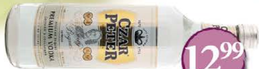
Czar Peter Premium Vodka LITER